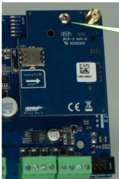
3. Centrala z zainstalowanym modułem.