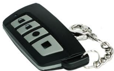
TR-4 – pilot do RF-4